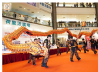
龍舟總會由今日起於鑽石山一商場構建萬呎室內陸上龍舟體驗館。