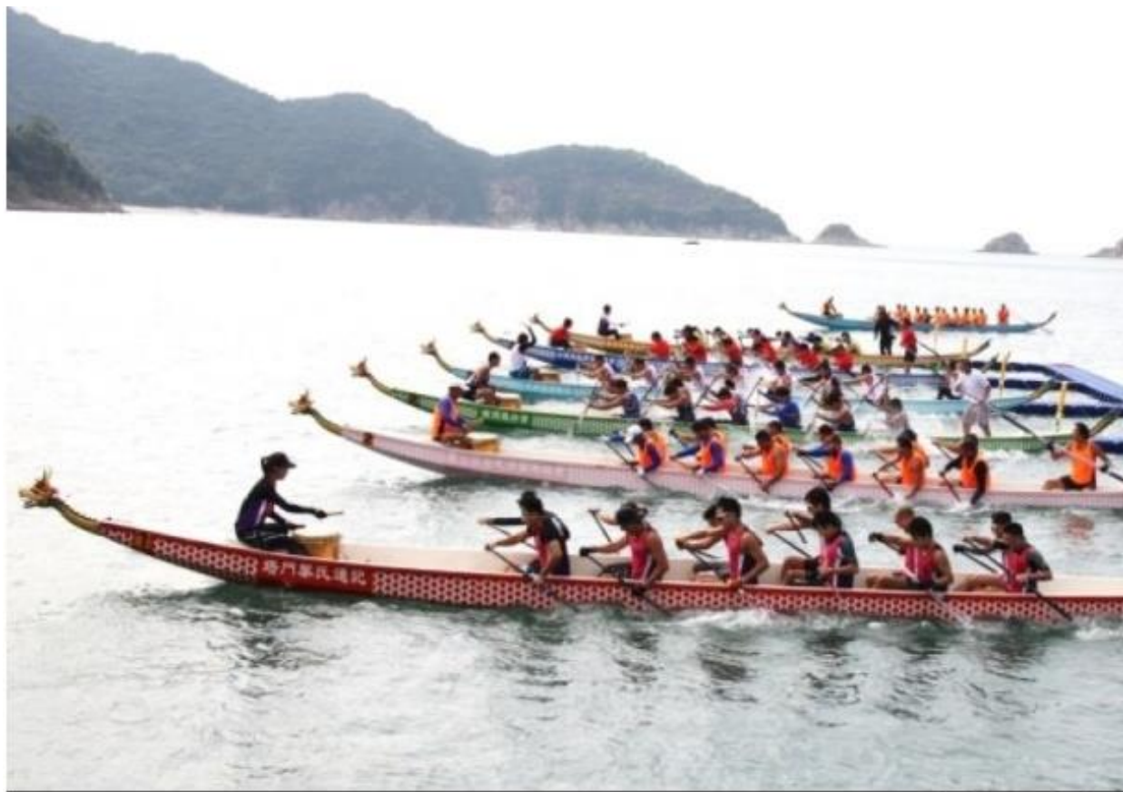
今年「香港國際龍舟邀請賽」將首次移師中環海濱公園舉行。(資料圖片)