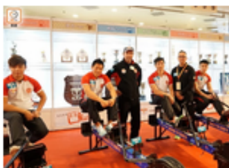
室內陸上龍舟體驗館讓市民體驗龍舟樂趣。

中國香港龍舟總會主席馬兆榮批評，政府對龍舟運動支持度不足，認為香港太過着重推廣精英運動，若將龍舟運動推廣至國際層面，需資金支持及各界認同。他冀政府可撥款資助，令他們不用再為籌集資金而煩惱。馬解釋，現時龍舟運動員缺乏訓練場地，而啟德的場地水位沒有高低潮，亦沒有海浪，只要封起缺口便可作訓練，故冀場地盡快啟用。